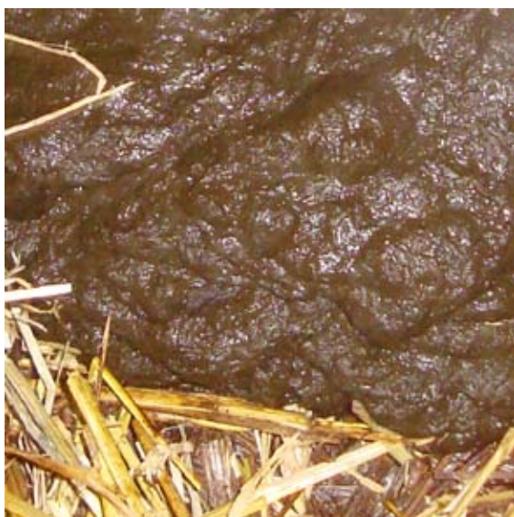
Deze mest is niet te donker en niet te licht, er zijn weinig onverteerde resten en de consistentie is goed wat wijst op een goede pensvertering