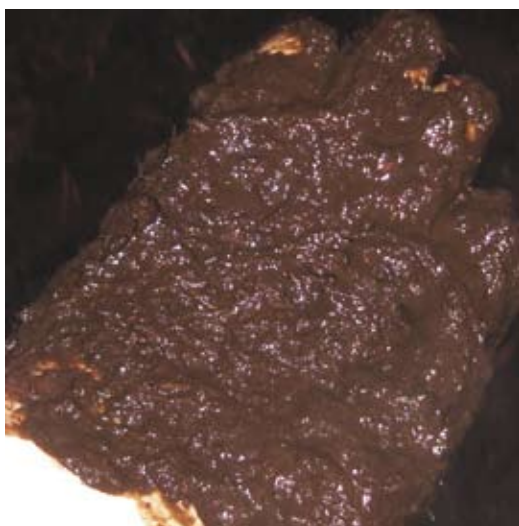
Dunne donkere mest is een teken van OEB-overschot