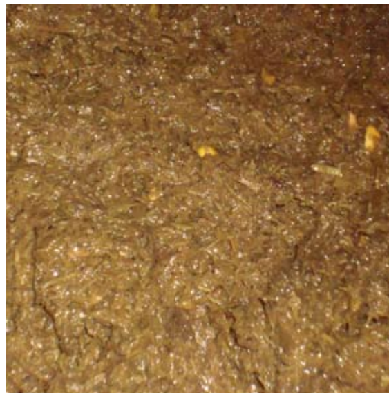
Veel onverteerde vezels en zaden in de mest wijzen op een slechte pensvertering

Bij een mineralentekort kan een aanvulling met een mineralenkern tijdens de lactatie of in de groeifase wenselijk zijn. Mineralentekorten inzake spoorelementen kunnen gedeeltelijk aangepakt worden door de soortenrijkdom in de graasweiden te vergroten. Denk hierbij aan smalle weegbree, duizendblad en wilde cichorei die mee ingezaaid kunnen worden in de grasklaver.