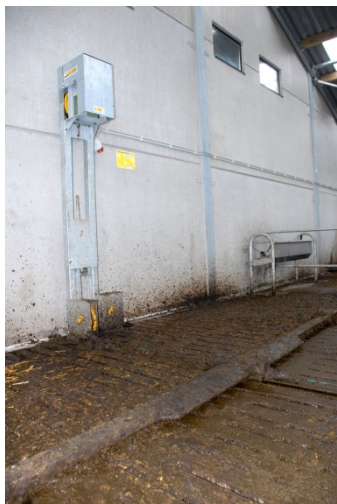
Figuur 1: mestschuif op Hooibeekhoeve (2005 – 2016)