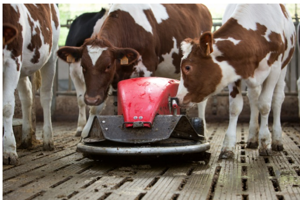
Figuur 6: Mestrobot Lely Discovery van Hooibeekhoeve