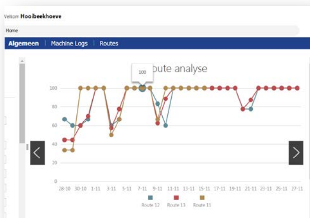
Figuur 4: voorbeeld route analyse