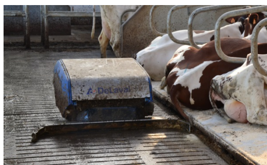
Figuur 2: mestrobot Delaval RS450(S) van Hooibeekhoeve